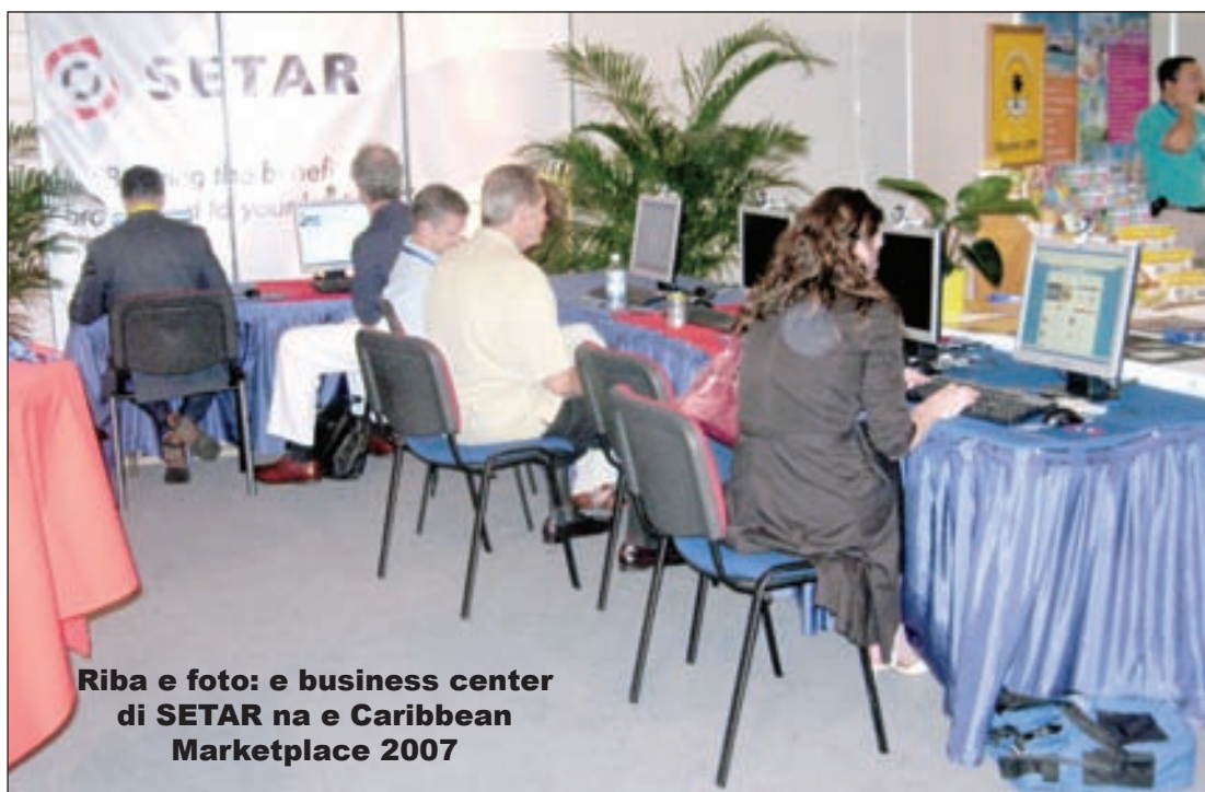
Riba e foto: e business center di SETAR na e Caribbean Marketplace 2007

San Nicolas Business Association a eligi directiva nobo